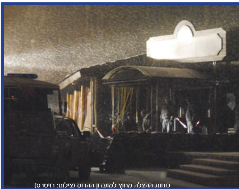
כוחות הצלה מחוץ למועדון ההרוס