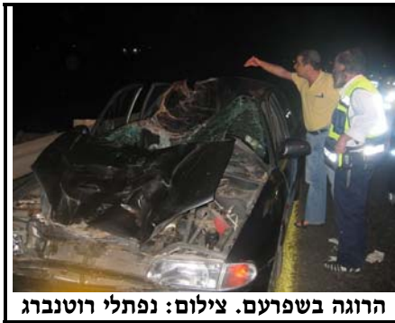
הרוגה בשפרעם.

קשה בשדרות משה דיין, בשכונת פסגת זאב. יעקב ועג, מתנדב זק"א שהגיע למקום, סיפר כי "מתנדב שלנו מ'הצלה מהירה' דיווח על תאונת דרכים קשה, שבה הולכת רגל נפגעה מרכב. הוא הגיע למקום ומצא שם אשה ללא רוח חיים, שנפגעה בראשה וברגליה, לצערי, לא נשאר הרבה מה לעשות".