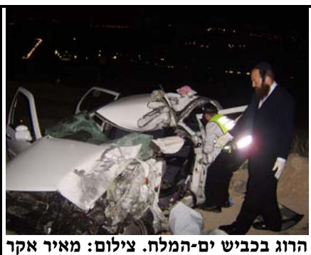
הרוג בכביש ים-המלח.

בצהרי יום חמישי במחלף לה גוורדיה בנתיבי איילון נהרג רוכב אופנוע מפגיעת אמבולנס של מגן-דוד-אדום, שחצה את הצומת באור אדום בדרכו למקרה אחר.