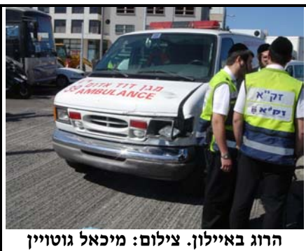
הרוג באילון.

עם סיום כתיבת שורות אלו הפכה הכותרת לפחות רלוונטית, ב-2 תאונות נוספות במהלך יום חמישי נוספו 2 הרוגים למעגל הדמים בכבישים.