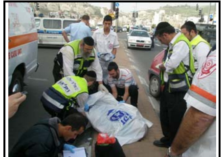
הרוגה בירושלים.

הולכת רגל, כבת 80, נהרגה בבוקר יום שלישי בתאונת דרכים שאירעה ברחוב משה דיין בשכונת פסגת זאב בירושלים. המשטרה עיכבה לחקירה את הנהג הפוגע. הקשישה הזו היא הקורבן ה-100 בכבישי ישראל מאז תחילת השנה.