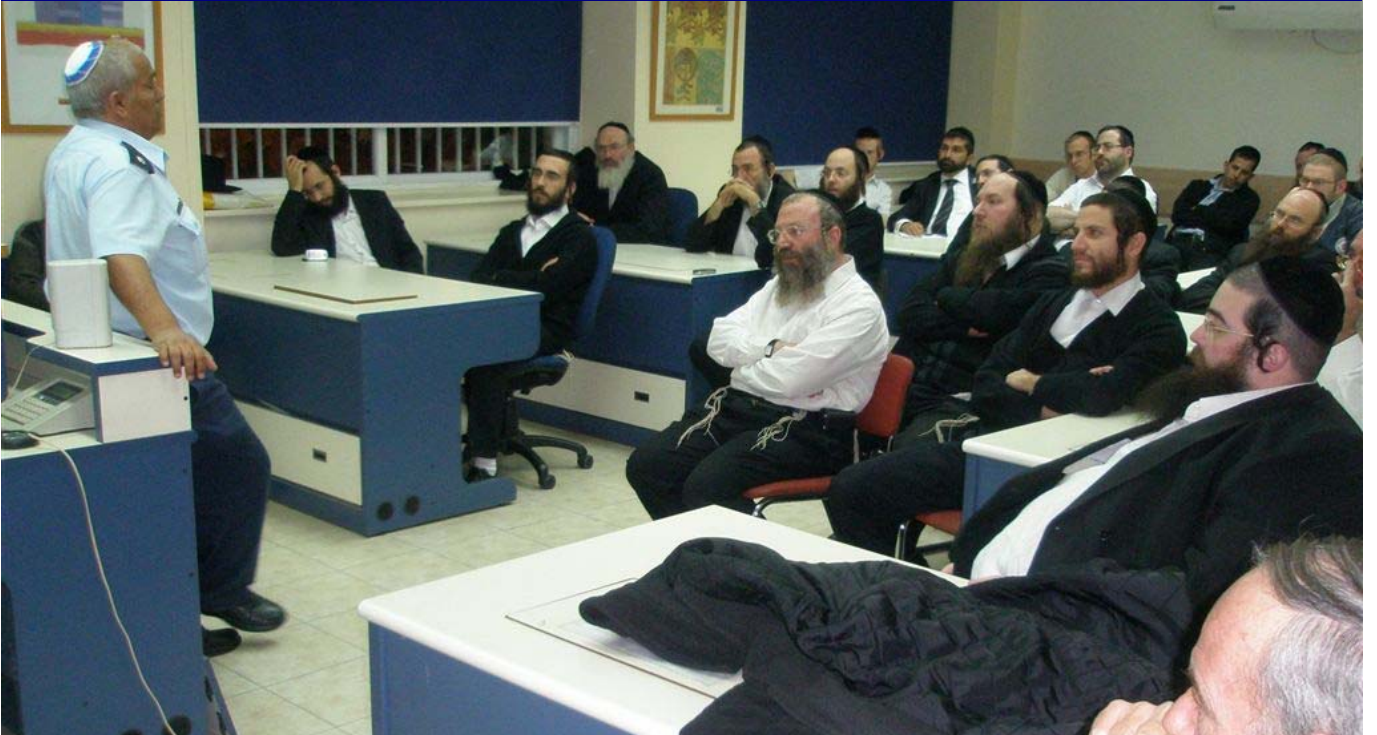
קורס השתלמות רעידת אדמה למתנדבי מחוז ירושלים.